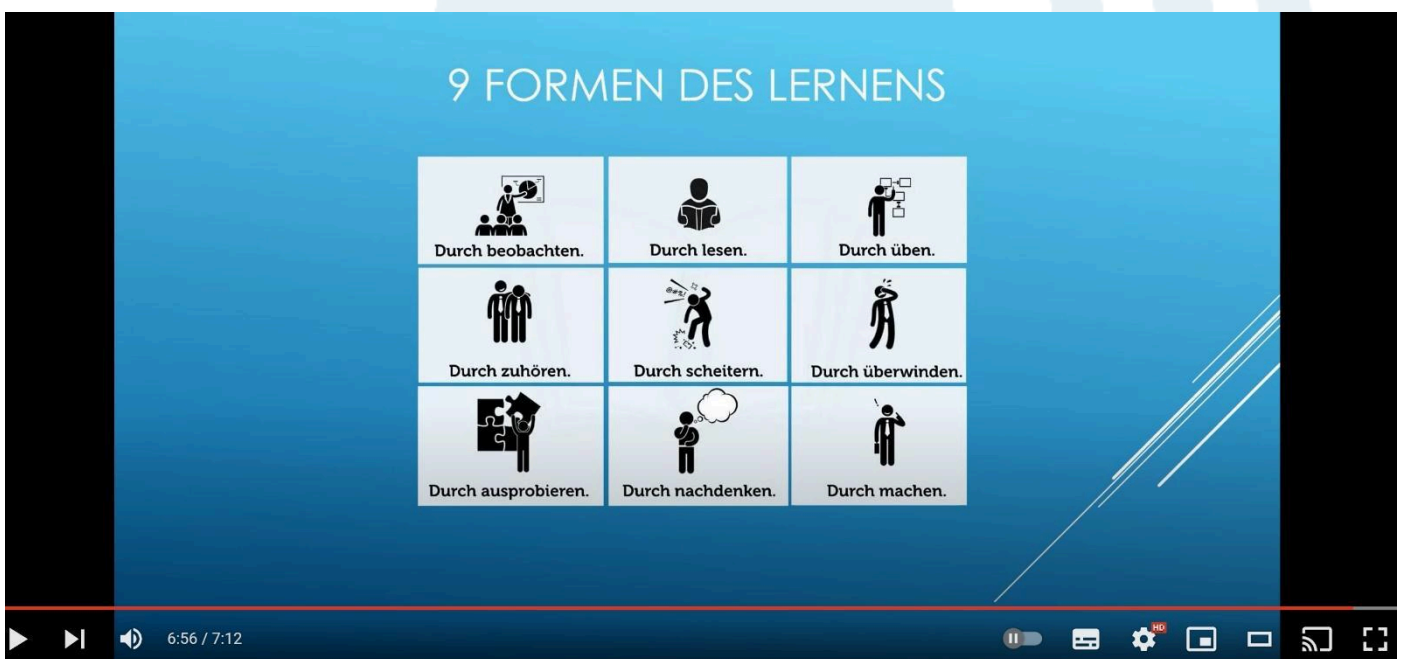
Lebenslanges Lernen - Das Konzept kurz dargestellt

Sehen Sie sich dieses inspirierende Video von Andreas Bachhuber an, um mehr über lebenslanges Lernen zu erfahren: Lebenslanges Lernen - Das Konzept kurz dargestellt . https://www.youtube.com/watch?v=1-RV8tH9hI